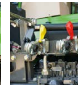
Als de parkeerrem is ingeschakeld, werkt de luchtdrukrem met dubbel circuit ook op de aanhanger.