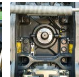
U kunt kiezen uit twee aftakassnelheden: 1000 en 1000E.