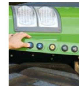
Achterhef, aftakas en een hydrauliekventiel bedient u gemakkelijk vanaf de achterspatborden.