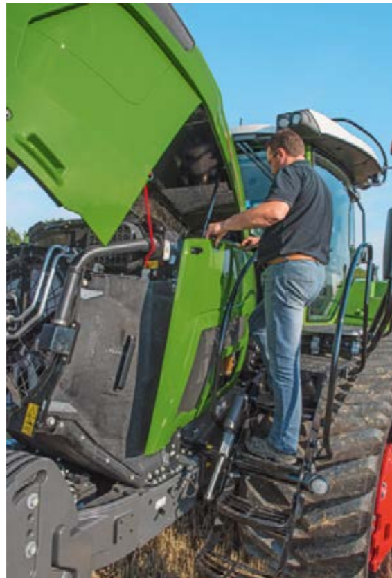
De motorruimte is door de afneembare zijstukken zeer goed toegankelijk.