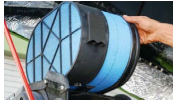
Het luchtfilter is gemakkelijk te vervangen en is voorzien van een vuilsensor die informatie geeft over de filterwerking.