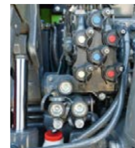
De hydrauliekaansluitingen zijn voorzien van kleurkenmerken. Daardoor zijn werktuigen snel en veilig aan te koppelen.