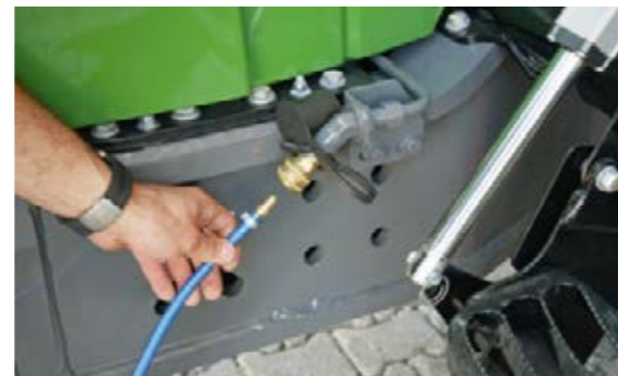
Voor aan de machine bevindt zich een persluchtaansluiting om de koeler schoon te blazen.