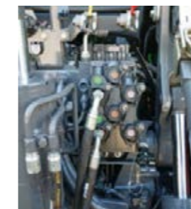
Het hydraulieksysteem is ontworpen voor de hoogste capaciteit en kan maar liefst 440 l/min bij 1700 t/min leveren.