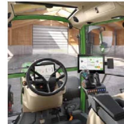
Profi Setting 2 - 3L-joystick - 2 lineaire modules (1 paar wipchakelaars) voor het bedienen van de hydrauliekventielen - 12"-terminal