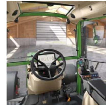
Profi Setting 1 - Kruishendel - 2 lineaire modules (1 paar wipchakelaars) voor het bedienen van de hydrauliekventielen