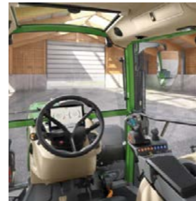
Power, Setting 2 - Kruishendel - Geen lineaire module (geen wipchakelaar-paar)