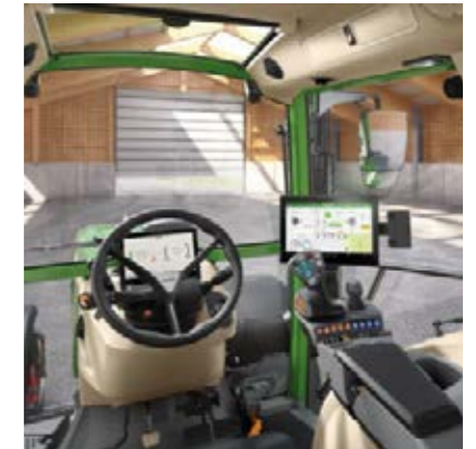
Profi+ Setting 1 - Kruishendel - 2 lineaire modules (1 paar wipchakelaars) voor het bedienen van de hydrauliekventielen - 12"-terminal