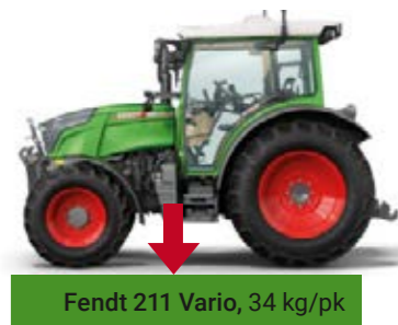
Fendt 211 Vario, 34 kg/pk

Zowel in akker- als weidebouw leidt bodemverdichting tot minder opbrengsten. Door de ruime bandenkeuze en de lage gewicht-vermogensverhouding van de Fendt 200 Vario wordt de bodem ontzien. Want met slechts 4280 kg en 34 kg per pk is de Fendt 211 Vario een echt lichtgewicht. Bovendien kan indien nodig het gewicht flexibel worden aangepast met behulp van ballastgewichten. Op de kopakker profiteert u van de uitstekende wendbaarheid: de draairadius bedraagt slechts 4,2 meter (minimaal).