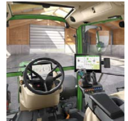
Profi+ Setting 2 - 3L-joystick - 2 lineaire modules (1 paar wipchakelaars) voor het bedienen van de hydrauliekventielen - 12"-terminal