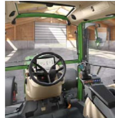
Power, Setting 1 - Zonder kruishendel - 2 lineaire modules (1 paar wipchakelaars) voor het bedienen van de hydrauliekventielen

Per uitvoering steeds keuze uit twee verschillende Settings. Op onderstaande foto's ziet u cabine-interieurs van verschillende modeluitvoeringen met accessoires die als optie leverbaar zijn.