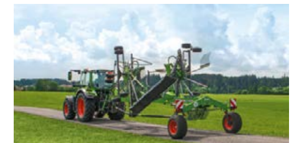
De volgordebesturing heft de rotoren van de Fendt Former zwadhark op de kopakker perfect uit.