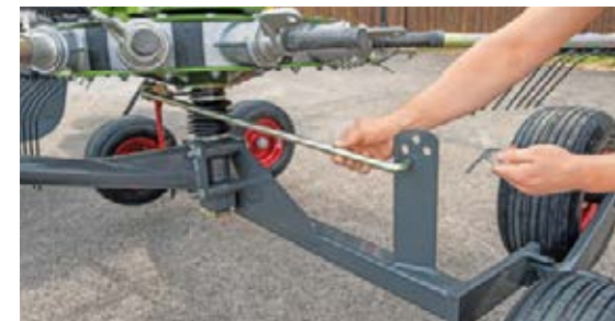
Of het materiaal nu zwaar, kort of licht is: de curvebaan past u eenvoudig aan de oogstomstandigheden aan.