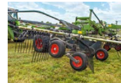
Bij het laten zakken op de kopakker raken eerst de achterste wielen de grond, daarna de voorste. Bij het uitheffen gaan de voorste rotoren het eerst omhoog. Dankzij dit zgn. jet-effect wordt de zode ontzien.